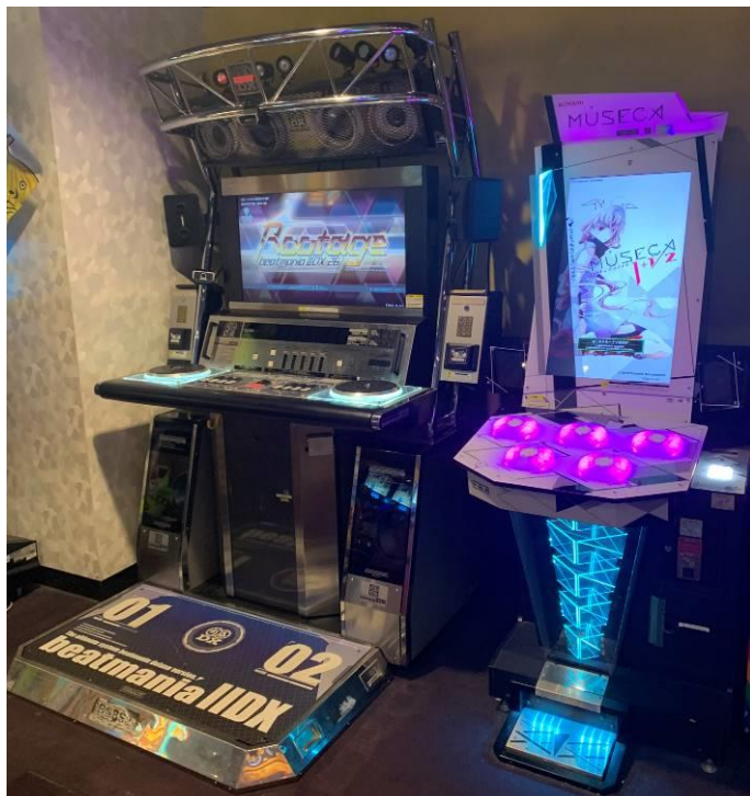
▲突如として登場した 1 作前の Rootage(ラウンドワン川崎大師店)